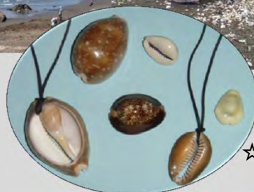
☆タカラガイのペンダント