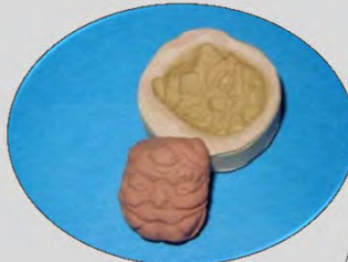
☆泥(どろ)めんこ (ねん土のおはじき)