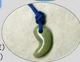
☆勾玉(まがたま) (石のペンダント)