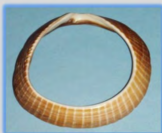
☆貝輪(かいわ) (貝のブレスレット)