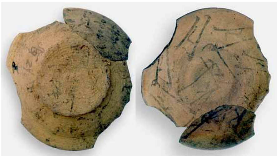
「貞観十七年」銘土器

るほか、「貞観十七年」 (875) の銘があり、祭りを行った日時を知ることができます。このことから、土器年代の研究にも大きく貢献しています。