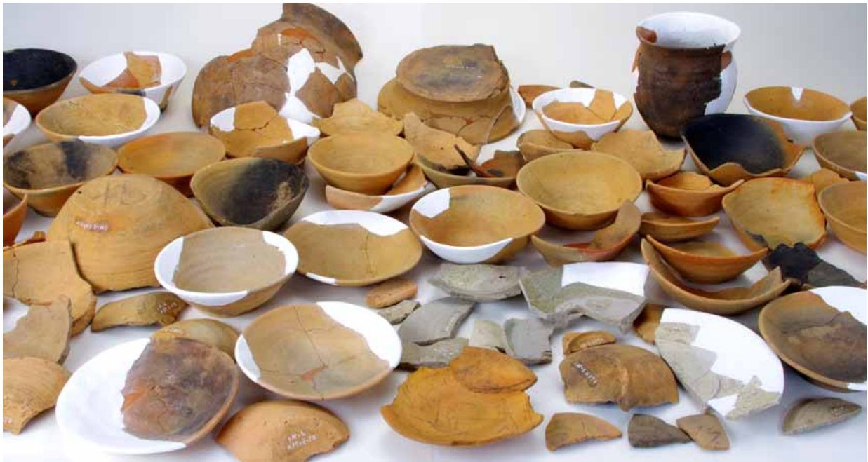
市指定文化財 37号住居跡出土土器一括（「貞観十七年」銘土器は最下中央）

【 いけにえ 生贄を捧げる】このほか、生贄を捧げる祭りも行われていました。鹿、猪、牛を屠殺し、お供えしたのでしょうか。その後、頭部を土器の上に乗せ、埋めています。